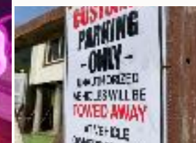
←夜はペンションがBAR

全ての方に気持ち良くご利用して頂く為、棟内外清掃のご協力をお願いいたします。ゴミは全て持ち帰りとなります。