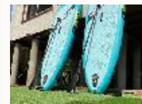
↑SUP 簡易コンビニあり→