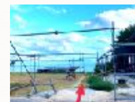
周防大島のプライベート↑