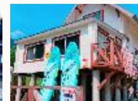
バス/トイレ/冷暖房付き